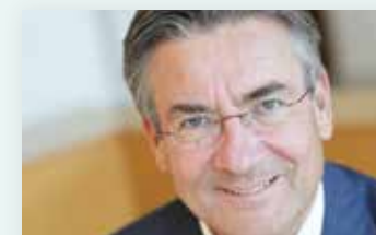
drs. M.J.M. (Maxime) Verhagen